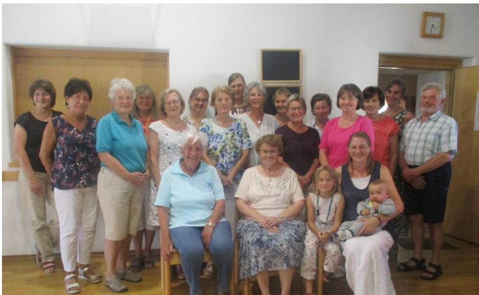
Foto: Sommerfest des Helferkreises am 10.8.2022 im Pfarrheim Kammer

Ganz viele Menschen aus Kammer und Umgebung engagieren sich in diesen Bereichen auf ganz unterschiedliche Weise. Dafür DANKEN wir euch von Herzen, denn dieses Engagement ist etwas ganz Besonderes.